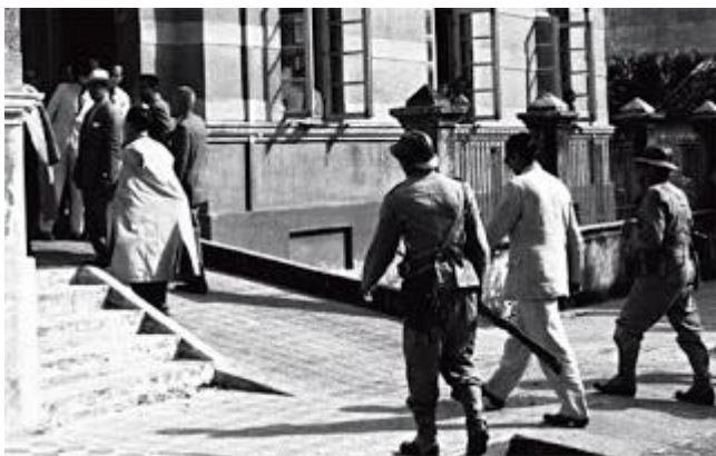
Por: Fábio Costa

No início da tarde do dia 13 de setembro de 1957, uma sexta-feira, um grupo de deputados chegou ao prédio da Assembleia Legislativa de Alagoas com uma peça de vestuário muito pouco adequada ao clima da cidade nessa época do ano. Num calor de 38°, os parlamentares estavam usando pesadas capas de chuva, sob as quais tentavam ocultar metralhadoras. Mal entraram no plenário, sem dizer uma palavra, abriram fogo a esmo, provocando a reação de deputados que já estavam entrincheirados no local.